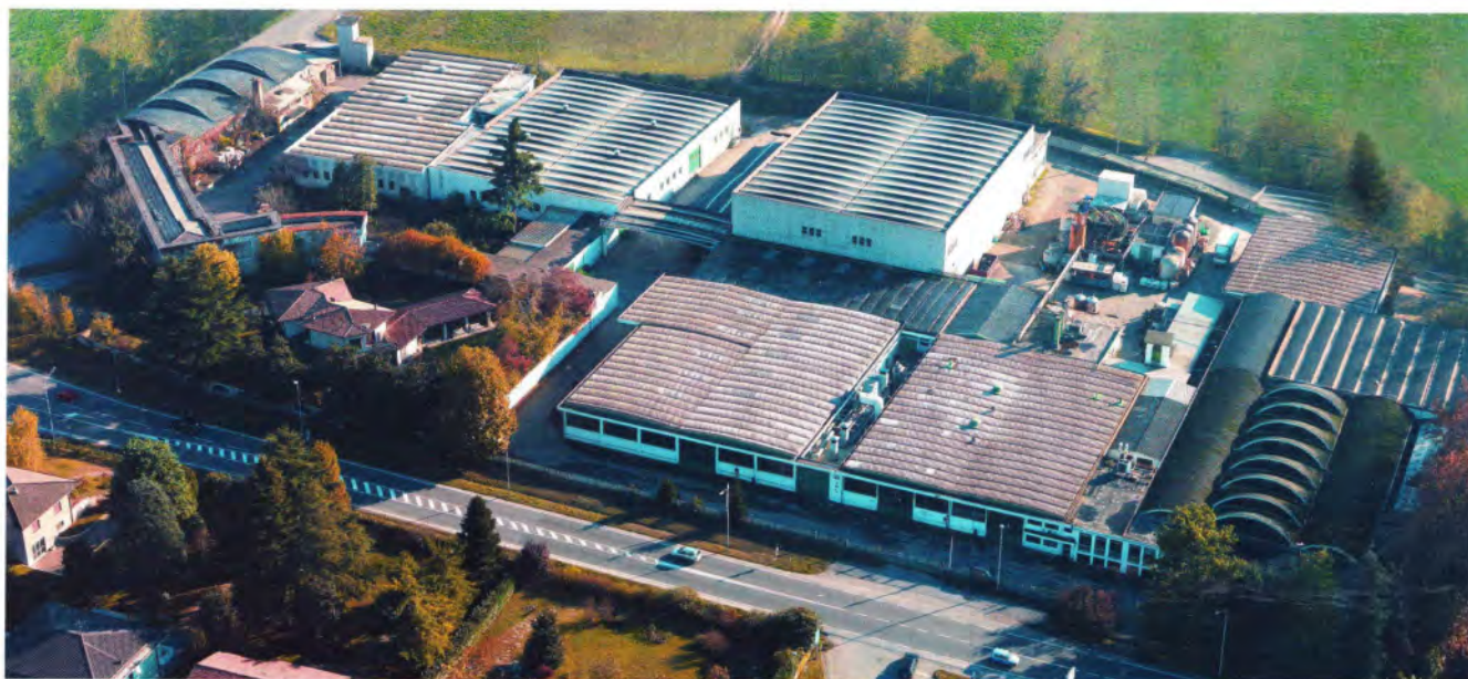
Zentrale von IML Industria Meccanica Lombarda ist in der Provinz Cremona (Italien).

terialien für solche unterschiedlichen Anwendungen verarbeiten und die gewünschten Verpackungen wie Kassetten, Boxen, Schachteln oder auch Schubert fertigstellen.