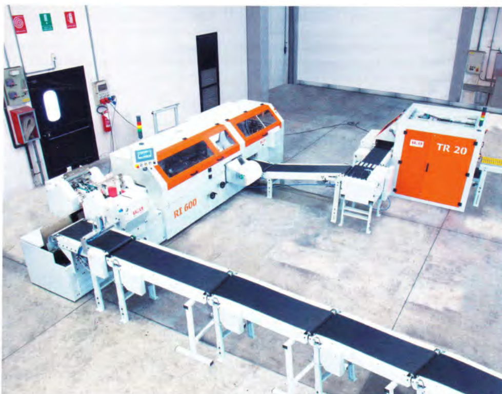
Neue Entwicklungen sind das Klebebinde-System RI 600 und der Dreiseitenschneider TR 20.

Wiederum das Kerngeschäft des Unternehmens liegt heute in der Verpackungs- und der Buchbinderei-Branche. Einstmals wurden Kleinserien von hochwertigen Schachteln für Spezialausgaben von Süßwaren, Parfüm, Spirituosen und Luxusprodukten verwendet. Ähnliche Verpackungen und Kartonmaterialien kommen zusehends für Fotobücher (insbesondere Hochzeitsalben), Immobilienpräsentationen und Kunstbuch-Editionen zum Einsatz. Mithilfe von IML Machinery-Equipment lassen sich die jeweiligen Karton- als auch Bezugsma-