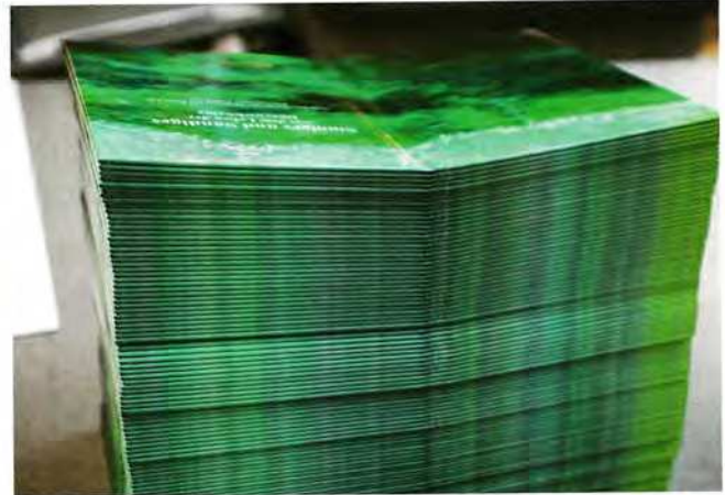
Robuste Hardcover-Decken: Längst produziert das Unternehmen zu 80 Prozent Hardcover-Bücher.

Benutzerfreundlichkeit boten dem Unternehmen für den Einstieg große Vorteile.