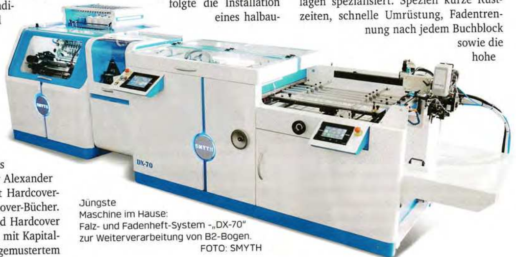
Jüngste Maschine im Hause: Falz- und Fadenheftsysteem - „DX-70“ zur Weiterverarbeitung von B2-Bogen.

tomatischen Falz- und Fadenheftsystems Smyth-„DX-50“ im Jahr 2019. Zahlreiche Kleinstauflagen mit kurzen Lieferzeiten erforderten eigene Kapazitäten. Die „DX-50“ als manuell beschicktes modulares Fadenheftsysteem ist genau auf die Herstellung von Büchern und Katalogen aus digital gedruckten Bogen in Kleinstauflagen spezialisiert. Speziell kurze Rüstzeiten, schnelle Umrüstung, Fadentrennung nach jedem Buchblock sowie die hohe