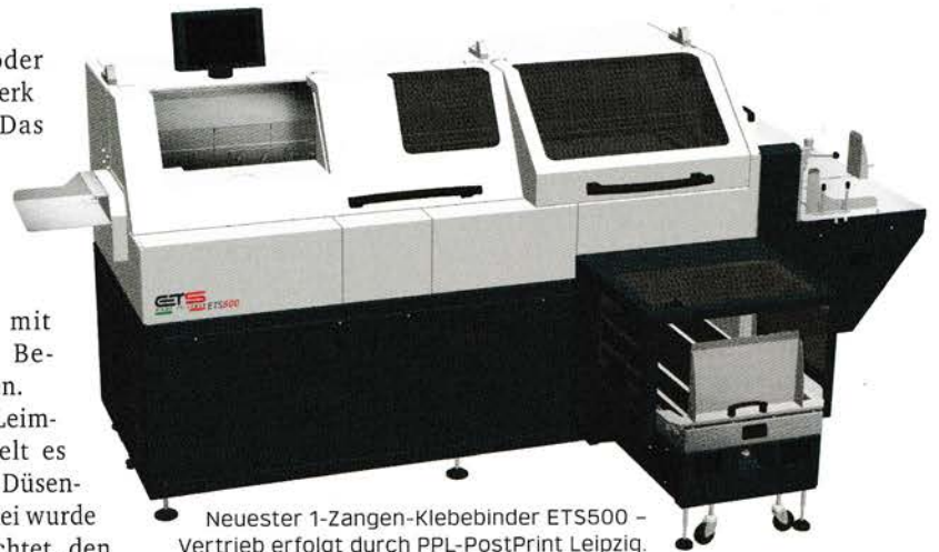
Neuester 1-Zangen-Klebebinder ETS500 – Vertrieb erfolgt durch PPL-PostPrint Leipzig.

Mithilfe des Umschlaganlegers sind maximal vier Rillen möglich, wobei die Rillung rotativ erfolgt. Eine integrierte Doppelbogen-Kontrolle stellt sicher, dass auch nur ein Umschlag zugeführt wird. Die Bedienung des Klebebinders erfolgt per Touchscreen. Schrittweiser Guide und logische Symboldarstellungen steuern die jeweiligen Maschinenfunktionen. Viele Bedienfunktionen vereinfachen die täg-